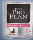
DELICATE Truthahn & Reis