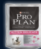
KITTEN DELICATE Truthahn & Reis

LASSEN SIE SICH VON DER PRO PLAN® PRODUKTPALETTE ÜBERZEUGEN.