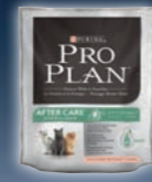
AFTER CARE Lachs & Thunfisch