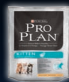
KITTEN Huhn & Reis