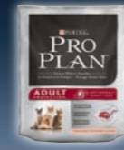
ADULT Lachs & Reis