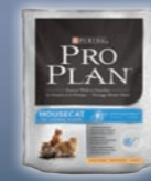
HOUSECAT Huhn & Reis