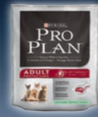
ADULT Ente & Reis