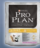
LIGHT Truthahn & Reis

Wenn Sie eine Packung PRO PLAN® mit nach Hause nehmen, können Sie sicher sein, dass das Produkt auf einer der weltbesten Forschungen basiert und nur aus hochwertigen Zutaten hergestellt wurde. Alle unsere Heimtierernährungsprodukte werden in den Purina PetCare Zentren umfassend getestet.