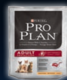
ADULT Huhn & Reis