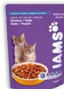
Kitten & Junior

Unser Sortiment beinhaltet auch Frischebeutel für Kätzchen sowie für Katzen im Alter von über 7 Jahren. Sie sind auf die speziellen Ernährungsbedürfnisse Ihrer Katze in diesen Lebensabschnitten abgestimmt und für die Tiere ein Genuss.