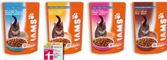
Adult in Sauce