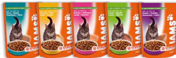
Adult in Gelee